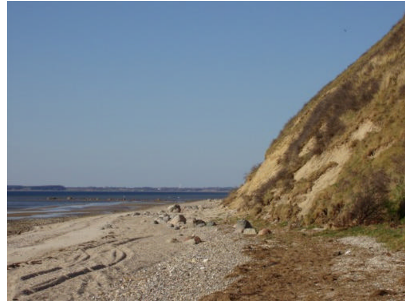
Ved Hjarbæk fjord Ca. 30 km

Start ved Ulbjerg camping og kør mod syd ind i Ulbjerg by. Ved forsamlingshuset drejes mod Sundstrup. Efter ca. 1,5 km tages en afstikker til højre mod Ulbjerg klint. Følg skiltene derud.