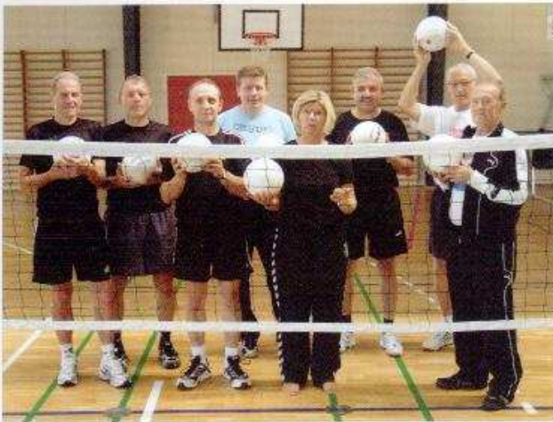
En aktiv bestyrelse i et aktivt center